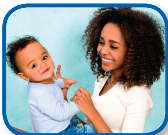
Acurrucados De 3 a 12 meses