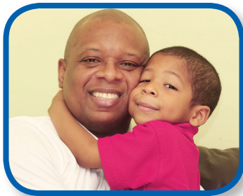
Abrazos De 0 a 12 meses