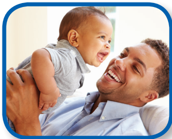
Te quiero De 0 a 12 meses