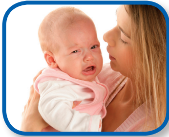
Aquí estoy De 0 a 12 meses